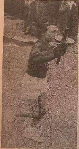
Dans la tradition...

Ont-ils concrétisé leur rêve ? Ont-ils grimpé sur la plus haute marche du podium ? Ont-ils fièrement rapporté à papa et maman cette médaille tant espérée ? Peut-être. Qu'importe après tout. Car les souvenirs restent : cette merveilleuse journée, cette joie éprouvée quasiment en