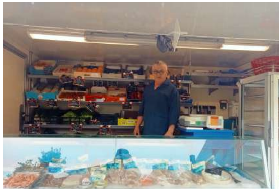
Gazette de Saint Hilaire – Imprimée par nos soins en 270 exemplaires – Directeur de la publication : Claude Hamard – Rédactrice : Gwénaëlle Hamard

Propos recueillis par Merlin Restoux-Pinglot